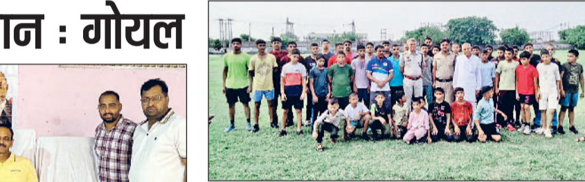
सोनीपत। जागरूकता कार्यक्रम के दौरान मौजूद पुलिसकर्मी व अन्य।