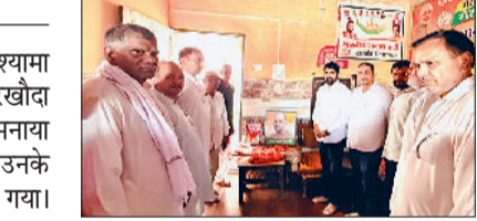
खरखौदा। डॉ श्यामा प्रसाद मुखर्जी के चित्र पर पुष्प अर्पित करते विधायक व अन्य।