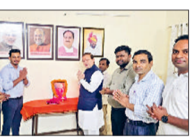
गौहाना। डॉ श्यामा प्रसाद मुखर्जी के चित्र पर पुष्प अर्पित करते विधायक व अन्य।

कैबिनेट मंत्री डॉ. अरविंद शर्मा ने कहा कि भारतीय जनसंघ के संस्थापक डॉ. श्यामा प्रसाद मुखर्जी का जीवन देश की एकजुटता व अखंडता को समर्पित रहा। उन्होंने देश को कश्मीर से लेकर कन्याकुमारी तक एक सूत्र में पिरोने के सपने पर खुद को बलिदान किया। वह सोमवार को गौहाना में अपने कार्यालय पर डॉ. श्यामा प्रसाद मुखर्जी के बलिदान दिवस आयोजित समारोह को संबोधित कर रहे थे। मंत्री डॉ. अरविंद शर्मा ने कहा कि डॉ. श्यामा प्रसाद मुखर्जी ने देश की एकता और अखंडता के लिए अपने प्राणों का बलिदान दिया। हाल ही में हुए ऑपरेशन सिंदूर का जिक्र करते हुए उन्होंने कहा कि यह भारत की सैन्य शक्ति का प्रतीक है जिसे प्रधानमंत्री नरेंद्र मोदी की इच्छाशक्ति ने संभव बनाया है। डॉ. श्यामा प्रसाद मुखर्जी एक दूरदर्शी स्वतंत्रता सेनानी,