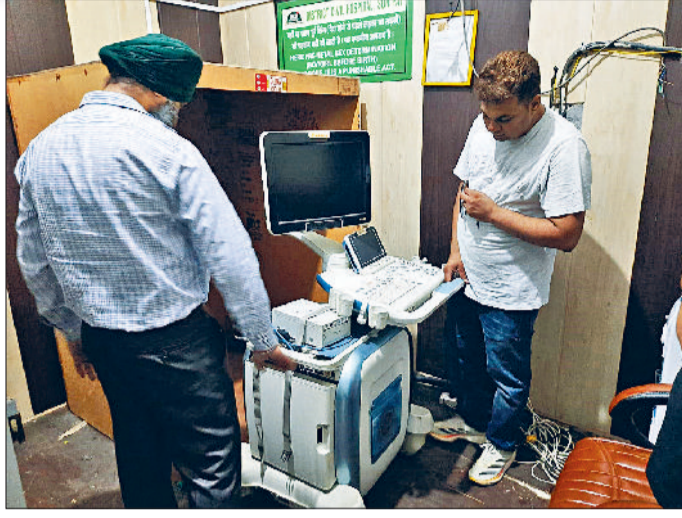
सोनीपत। मशीन को पीटी से निकालते हुए टीम के सदस्य।