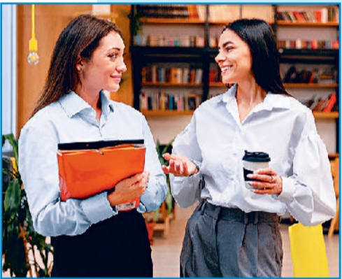
मजाक आदि तभी करें, जब आपके पास स्पेयर टाइम हो। आप पब्लिक ट्रांसपोर्ट या पूल कार से ट्रेवेलिंग के दौरान या फिर ऑफिस आवर्स खत्म होने के बाद ही पर्सनल बातें या गॉसिपिंग कर सकती हैं।

हर काम का एक वक़्त होता है। जब आप किसी जरूरी ऑफिसियल प्रोजेक्ट पर काम कर रही हों तो उस दौरान कुलीब्स से बातचीत करने में समय नष्ट न करें। गॉसिप, हंसी-